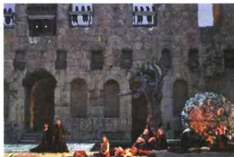
Μαριάννα Πενσεβέ - Βάλτερ Φρακάρο, από την πρόβα του «τροβατόρε»

Το άνοιγμα της Λυρικής Σκηνής με μικρά κλιμάκια τραγουδιστών σε εξωτερικούς χώρους, σε πλατείες και γειτονιές, δεν θα περιοριστεί μόνο στο κλεινόν άστυ. Το φετινό καλοκαίρι, ένα κλιμάκιο 12 τραγουδιστών (Ελενα Κελεσίδη, Χάρης Ανδριανός, Διονύσης